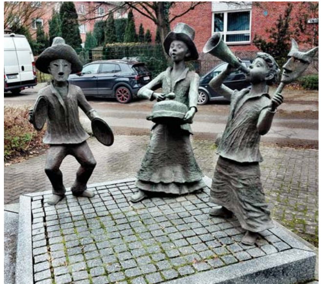
„Rummelpottlaufen“-Skulptur von Gerhard Brandes

„Ick bin een armen König, giv mi nich to wenig, loot mi nich so lang stohn, denn ick mutt noch wieder gohn!“ – wer das am frühen Silvesterabend hört, sollte lieber etwas Gebäck (Futjes - lecker!), Süßes oder Fruchtiges griffbereit haben. Furchterregend verkleidete und geschminkte kleine Gestalten veranstalten mit Kochlöffel und Topf oder Pfanne ein lautes Spektakel. Sie haben einen Sack dabei, in den können Sie ihnen etwas stecken. Auch heute noch ziehen vorwiegend Kinder, z.B. in Hamburg-Altona oder in Blankenese, lärmend und singend von Tür zu Tür beim Rummelpottlophen, einem sogenannten „Heischebrauch“, vorwiegend bekannt im norddeutschen Raum, in Holland und in Dänemark. Namensgebend ist der „Rummelpott“, ein Brummtopf. Über die Öffnung eines Topfes wurde eine Schweineblase gezogen, durch die man einen Stock steckte. Drehte man diesen, erzeugte der Topf einen Brummtön. Sprachlich stammt es vom niederdeutschen Wort „Rummeln“, gleichbedeutend mit „Poltern“ ab. Damit sollten in den Raunächten um die Jahreswende die Wintergeister vertrieben werden. Längst nehmen die Kinder andere bruchfeste Gegenstände, wie Pfannen und Töpfe. Schweineblasen sind nicht mehr aktuell. Dafür die niederdeutschen Lieder und Reime, wie zu Beginn des Textes, mit denen die Kinder um Gaben bitten, wie auch das klassische Lied: „Fruu, maak de Dör op“. Sollten die Nachbarn mal nichts geben wollen, kann auch das