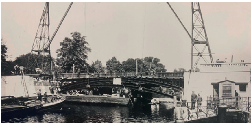
Bau der Stahlbogenbrücke, ca. 1921