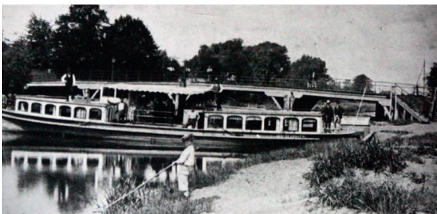
Erste Straßenbrücke aus Holz, ca. 1841