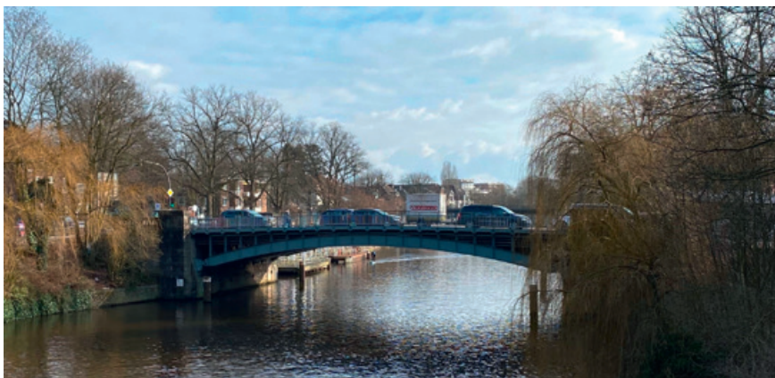
Winterhuder Brücke, 2025