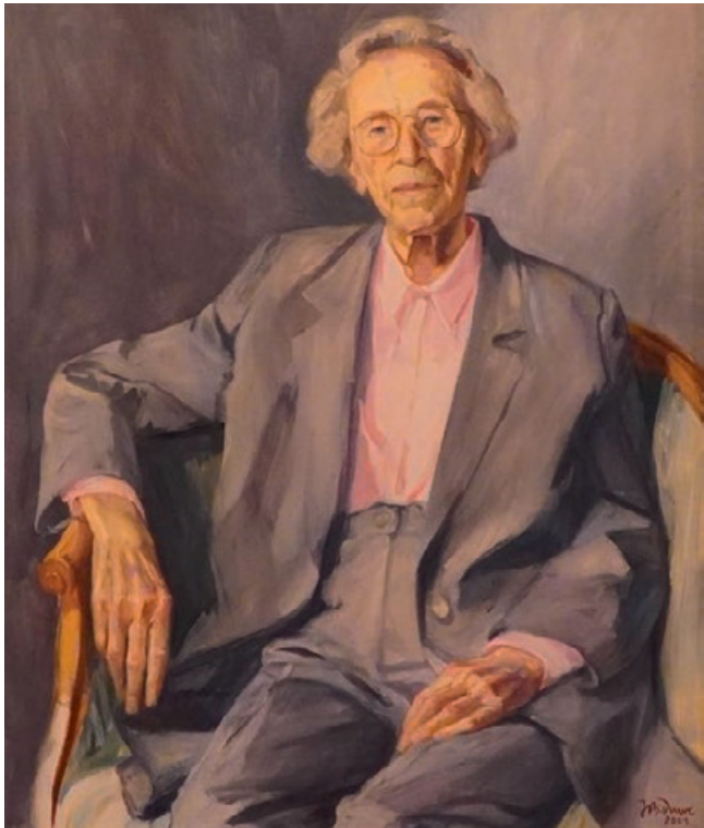
Porträt im Rathaus