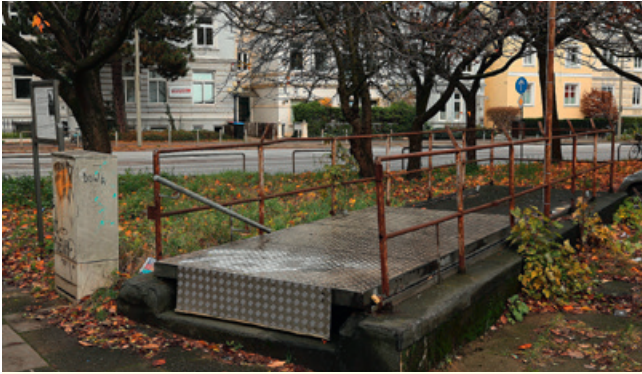
Unter der Metallplatte an der Tarpenbekstraße verbirgt sich Historie