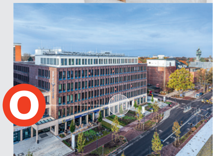
OTON Die Hörakustiker am UKE GmbH in Hamburg Eppendorf.

beste Kundenzufriedenheit | bester Service | beste Preise