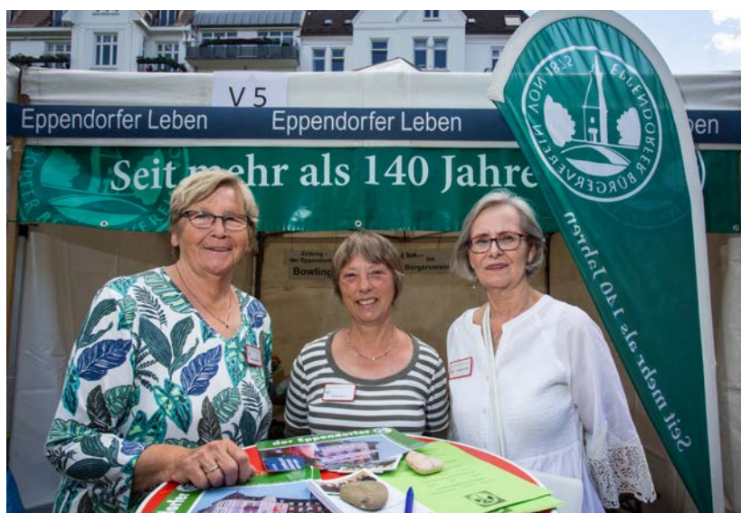
TBA – uba-bergmanngruppe 2022