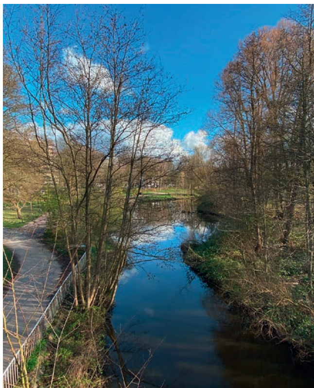
Heute: C. Altstaedt