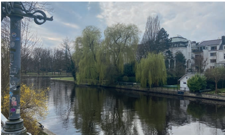
Alster und Gebäuden am anderen Ufer: Leinpfad

Die viel zu lang andauernde dunkle Jahreszeit wird langsam, aber sicher vom Frühling abgelöst. Daher möchte ich Sie, liebe Leser:innen auf einen fabelhaften Spaziergang durch Eppendorf, Winterhude bis nach Harvestehude mitnehmen. Die Viertel sind bekannt für ihre malerischen Altbauten, charmanten Straßen mit kleinen Läden verschiedenster Art und natürlich die schönen Parks und Grünanlagen. Beginnen wir unseren Spaziergang im Eppendorfer Park. Gelegen zwischen Martinstraße und Breitenfelder Straße. Eine kleine Oase neben dem UKE. Gesäumt von majestätischen Bäumen und einem malerischen Teich im Zentrum des Parks. Von dort aus schlendern wir durch die Haynstraße in Richtung der Eppendorfer Landstraße und der Bahnstation Kellinghusenstraße. In den idyllischen Straßen betrachten wir prächtige Altbauten mit ihren verzierten Fassaden, aus denen man die Geschichte beinahe „sprechen hören“ kann. Neben dem Eingang zum Bahnhof, biegen wir in den Kellinghusenpark ein. Wenngleich einer der kleineren Grünflächen, so ist die Luchsstatue in der Mitte des Parks ein Hingucker! Von dort aus führt uns unsere Reise nach Norden über die Eppendorfer Landstraße in Richtung eines echten Juwels des Viertels: Dem Haynspark. Weitläufige Fußwege, verwunschene kleine Brücken und ausreichend Bänke machen diesen Park besonders schön. Nach einer Runde